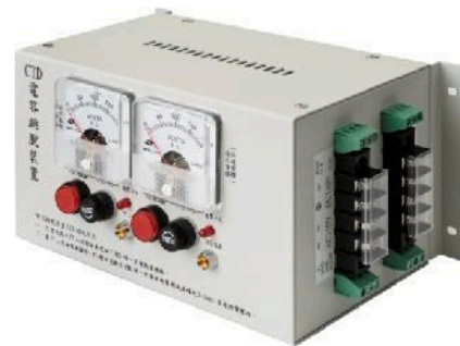
固定式雙電錶型 自動轉換電源電容跳脫裝置

型號： CTD — 110 — 155 — 04/08 — MM — MIT ① ② ③ ④ ⑤ ⑥