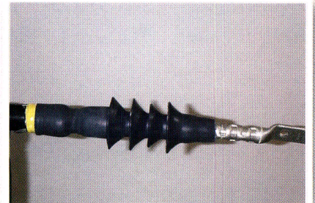
3. 拉完支撐管後，安裝完成