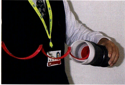
1. 安裝前先將紅色支撐管拉掉