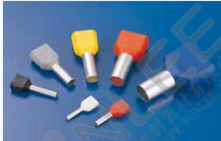
1506 雙線套歐式端子 TWIN CORD END TERMINAL