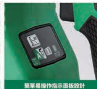
簡單易操作指示面板設計