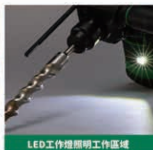
LED工作燈照明工作區域